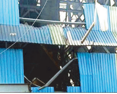
बंकर का टूटा हिस्सा।

एसईसीएल की कुसमुंडा खदान में निर्माणाधीन बंकर का एक हिस्सा अचानक गिर गया। घटना के वक्त कर्मचारी भोजन