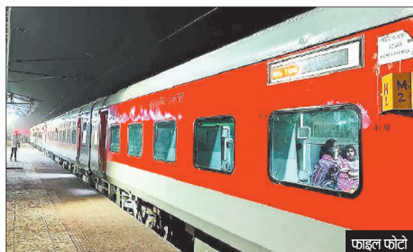
जिले से कोच्चिवेली एक्सप्रेस सप्ताह में दो दिन चलती है। साप्ताहिक ट्रेन होने एवं जिले से केरल की ओर जाने वाली एकमात्र सीधी यात्री रेल सेवा थी। जिले के औद्योगिक क्षेत्रों में एवं विभिन्न संस्थानों में काम करने वाले दक्षिण भारतीय परिवारों के

जिले से केरल की ओर जाने वाली कोच्चिवेली एक्सप्रेस (कोच्चिन एक्सप्रेस) बीते एक माह से रद्द चलने के कारण जिले से दक्षिण भारत की ओर जाने वाले उन यात्रियों को परेशानियों का सामना करना पड़ रहा है, जिन्होंने एक माह पूर्व ही इस ट्रेन में सफर करने के लिए अपनी सीटें बुक करा ली थीं। अब उन्हें कैंसल कराने की मजबूरी हो गई है। बार-बार यात्री ट्रेनों के कैंसल होने का खामियाजा यात्रियों को भुगताना पड़ रहा है।