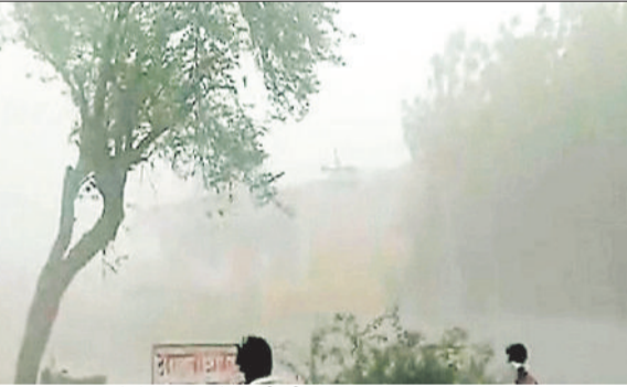
इस तरह शहर में देर शाम को आयी थी अंधड़।