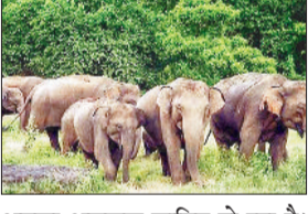
अमला असफल साबित हो रहा है। बीटी रात पहुंचे 27 हाथियों के इस दल ने गीतकुंवारी व लंबेद गांव में फिर उत्पात मचाते हुए ग्रामीणों के धान व मुंगफली की फसल को जमकर नुकसान पहुंचाया। पीड़ित ग्रामीणों द्वारा सूचना दिए जाने पर वन विभाग को उत्पात से रोकें के क्षेत्र के ग्रामीण काफी हलाकान है। वहीं उनमें दहशत भी व्याप्त है।

वन मंडल कोरबा अंतर्गत कुदमुरा रेंज के गीतकुंवारी व लंबेद गांव में हाथियों की सक्रियता बढ़ गई है। जिसे देखते हुए वन विभाग ने क्षेत्र में तेंदूपत्ता संग्रहण का कार्य फिलहाल रोक दिया है। यहां के जंगल में 25 हाथी घूम रहे हैं जो दिन में कोरबा व धरमजयगढ़ वन मंडल की सीमा पर घूबर जाता है और रात में लंबेद व गीतकुंवारी पहुंचकर यहां खेतों में उत्पात मचाते हुए ग्रामीणों के धान व मुंगफली की फसल को जमकर नुकसान पहुंचाया। पीड़ित ग्रामीणों द्वारा सूचना दिए जाने पर वन विभाग को उत्पात से रोकें के क्षेत्र के ग्रामीण काफी हलाकान है। वहीं उनमें दहशत भी व्याप्त है।