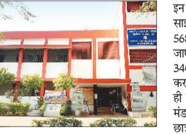
कोरबा में 15 गवर्नमेंट कॉलेज संचालित हैं। इन सभी कॉलेजों में स्नातक कोर्स (कला, वाणिज्य व साइंस) हैं। कुछ कॉलेजों में बीबीए, बीसीए व डीसीए कोर्स भी हैं। इसी तरह 13 प्राइवेट कॉलेजों में 1 नर्सिंग कॉलेज, 2 बीएड कॉलेज व एक लॉ कॉलेज हैं। इस तरह प्राइवेट के 9 कॉलेजों में स्नातक के सामान्य कोर्स संचालित हैं। सामान्य कोर्स से उच्च शिक्षा के लिए 24 कॉलेजों में छात्र-मिल जाएंगे पर कम अंक वालों को कॉलेजों का विकल्प तैयार रखना होगा।

नवीन शैक्षणिक सत्र 2024-25 के लिए अटल बिहारी वाजपेयी यूनिवर्सिटी से संबद्ध 28 कॉलेजों में प्रवेश की प्रक्रिया 16 जून से शुरू होगी। जिले में इस बार एक सीट पर